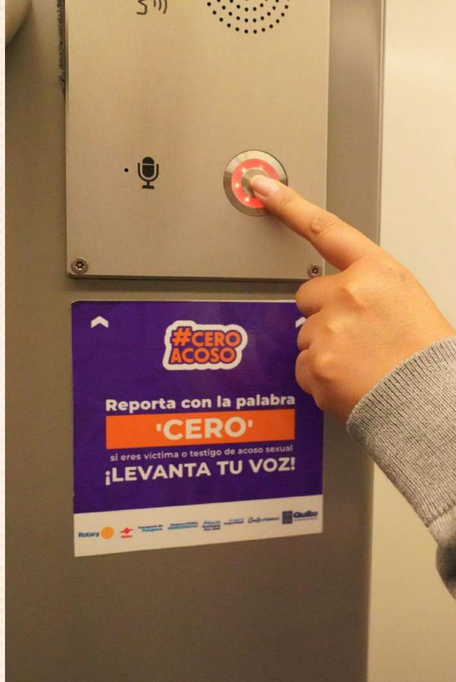
Interfono Metro Quito

Disminución de las brechas de contratación del personal del Metro de Quito.