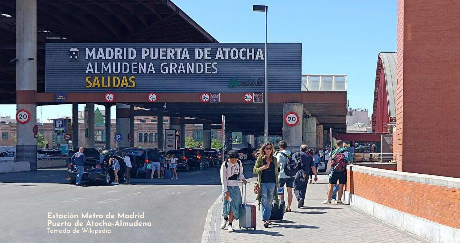
Estación Metro de Madrid Puerta de Atocha-Almudena

Diversas ciudades han avanzado en esta línea como parte de políticas de igualdad y memoria urbana.