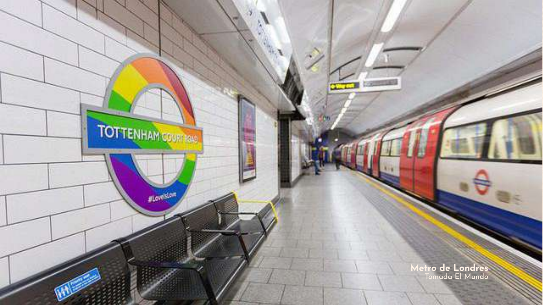
Metro de Londres

Igualmente, para visibilizar a las mujeres, se ha rediseñado el mapa del metro londinense conmemorando nombres de mujeres, personas no binarias y otros grupos que han aportado positivamente la ciudad, en sus estaciones, tales como: Amy Winehouse, Virginia Woolf, Jung Chang, entre muchas otras.