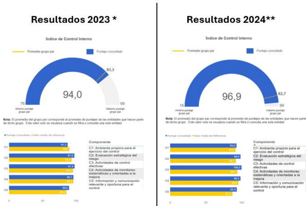
Imagen 3. Resultados Índice de Control Interno.