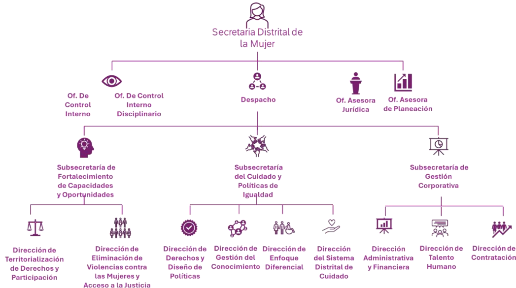
Imagen 1. Estructura Organizacional SDMujer

Elaboración propia. Oficina Asesora de Planeación. SDMujer, 2024.