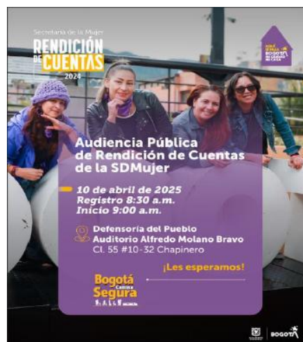
Imagen 1. Audiencia Pública BOGOTÁ CAMINA SEGURA”