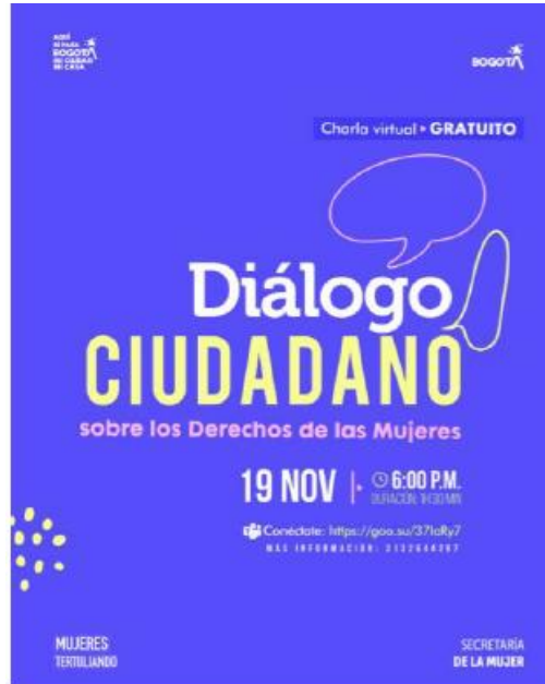
Imagen 4. Diálogo Ciudadano Mujeres Tertuliano sobre Cuidado