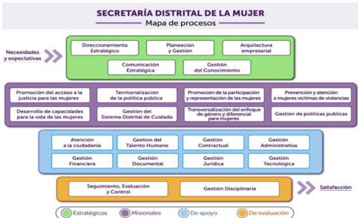
Gráfica 1 Mapa de Procesos

Los avances de las actividades para la mejora de gestión por procesos realizadas en el año 2023 han permitido avanzar en la integración del Sistema Integrado de Gestión con el proyecto de la Arquitectura Empresarial, para mejorar el entendimiento de los procesos de la entidad. En este sentido, se realizó la actualización del Mapa de Procesos de la entidad incluyendo el proceso de Arquitectura Empresarial, para un total de 23 procesos distribuidos así: 5 estratégicos, 8 misionales, 8 de apoyo y 2 de evaluación.