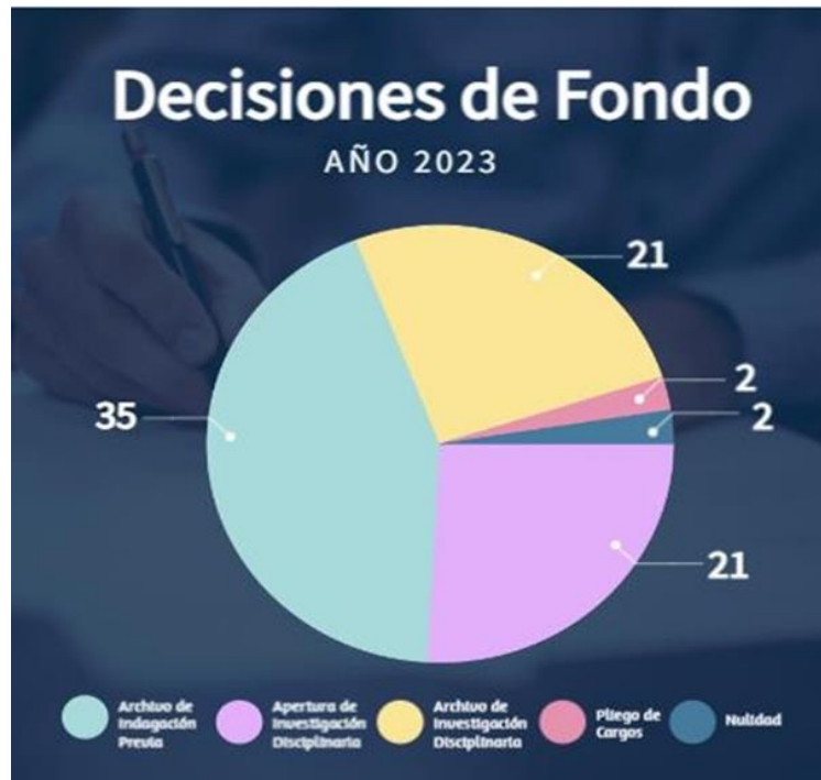
Gráfica 3 Función Correctiva