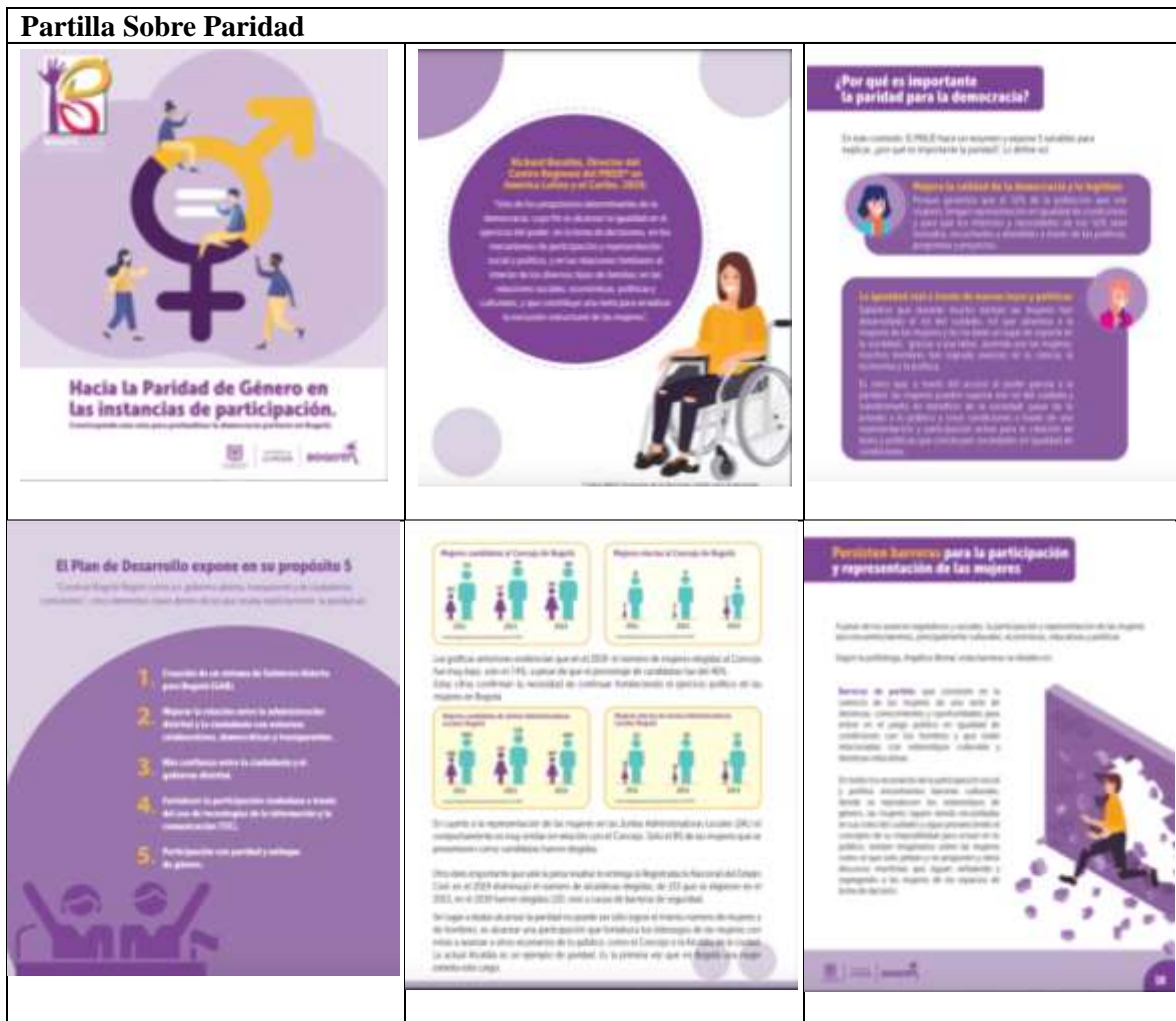
Fuente: equipo comunicaciones dirección de Territorialización de Derechos y Participación 2021.

Hasta el momento de ha desarrollado la cartilla sobre la paridad, la cual permite a las instancias tener a la mano la información y poderla compartir de manera digital a sus consejeros y demás personas interesadas de la ciudadanía. Y por otro lado se ha diseñado una presentación para el desarrollo de los encuentros.