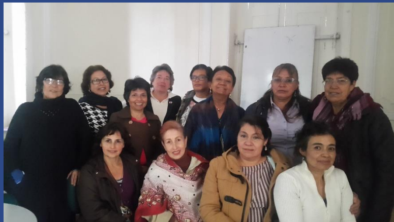
Mujeres del Consejo Consultivo de Bogotá EA, 2015 .Foto CCMEA